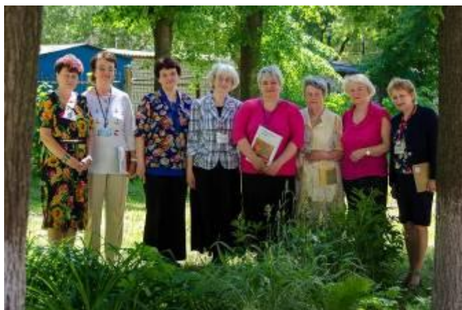
На фото: делегация из эстонского города Силламяэ

13 июня 2015 г. в Шуйском филиале Ивановского государственного университета состоялась Всероссийская научно-практическая конференция с международным участием «Космос Бальмонта: миры и люди», которой открылись XXVII Бальмонтские чтения. В конференции приняли участие бальмонтоведы из Москвы, Воронежа, Санкт-Петербурга, Ярославля, Красноярска, Иванова, Шуи, родственники поэта, краеведы, студенты филологи, школьные учителя. Как дорогих гостей встретили участники чтений делегацию из эстонского города Силламяэ, где ровно 110 лет назад Бальмонт написал знаменитые «Фейные сказки».