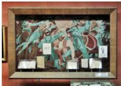
Илл. 3. Зал № 2. Панно «История одного города»

Затем уже по готовой живописи автор прошелся рукой мастера