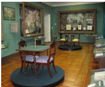
Илл. 2. Зал № 1. Фрагмент экспозиции: круглый столик из имения Спас-Угол, ломберный стол – из имения Ермолино