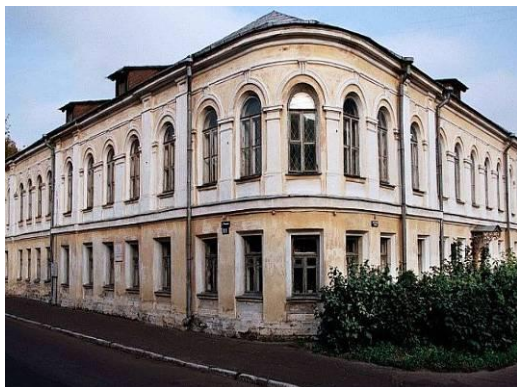
Илл. 1. Музей М.Е. Салтыкова-Щедрина в Твери

создании музея и предложили для его размещения особняк начала XIX века с пристройкой начала XX века в доме № 11 по улице Рыбацкой,